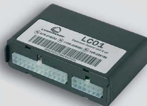
Nuova centralina elettronica LC01 per sistemi Lambda Control System GPL e metano