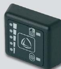
Nuovo commutatore/indicatore elettronico per sistemi Landirenzo Omegas e LCS GPL e metano