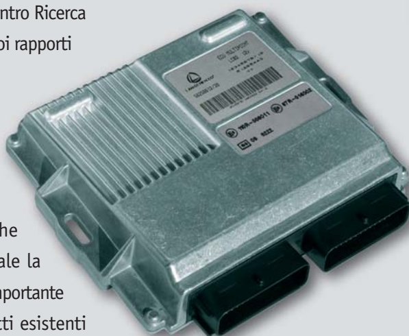
Nuova centralina elettronica LC02 per sistemi Landirenzo Omegas GPL e metano

Anche quest'anno Landi Renzo ha presentato sul mercato una serie di nuovi prodotti, in particolare componenti elettronici, che rinnovano in modo sostanziale la gamma attuale e segnano un'importante evoluzione rispetto ai prodotti esistenti sul mercato, per funzionalità, durata e tool di sviluppo.