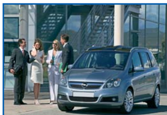
LANDI RENZO E I GRANDI COSTRUTTORI page 3