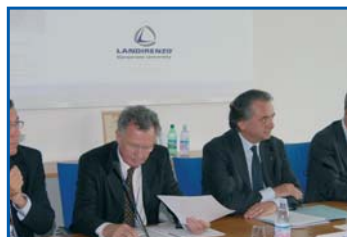
LANDIRENZO Corporate University pag. 2