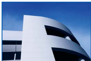
2006, CONTINUA L'ESPANSIONE pag. 1