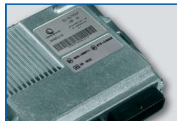
NUOVI PRODOTTI pag. 4

Il gruppo Landi guarda al futuro con grande fiducia. Negli ultimi 4 anni è stato triplicato il fatturato che supererà i 130 milioni di Euro alla fine del 2006. La quota di export è pari ad oltre il 70% del fatturato complessivo.